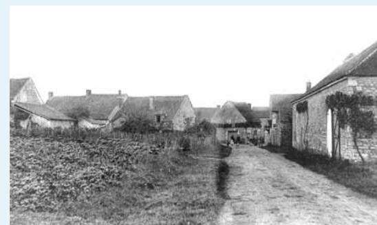
Les Bries - Entrée route d'Auxerre

D'autres fouilles reprendront en 2015 ! Nous vous en reparlerons !