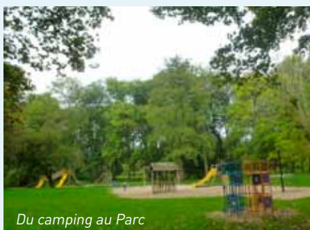
Du camping au Parc

Démolition des bâtiments vétustes devenus dangereux.