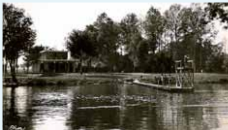
Années 50, le plongeoir du camping

Jusqu'à l'an 1429 notre ancien camping s'appelait Le Gué d'Epicelles . Mais cette année-là Jeanne d'Arc, qui se rendait à Gien, franchit la rivière Yonne pour se rendre à Seignelay. Depuis on dit « Le gué de la Pucelle ».