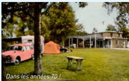
Dans les années 70 !

Tous les Apoviniens (nom donné aux habitants d'Appoigny à cette époque) et tous les Parisiens se retrouvent désormais à La Plage, tous les étés.