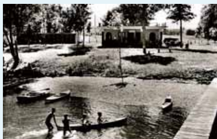
Années 50, la plage