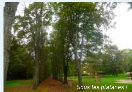
Sous les platanes !

Le devis estimatif de ces travaux avoisine les 200 000 Francs. Une subvention de 50 000 Francs a été demandée au Conseil Général et obtenue. Une autre de 60 000 Francs a été accordée au titre de la Dotation Globale d'Équipement par l'État. ( Bulletin Municipal n° 25)