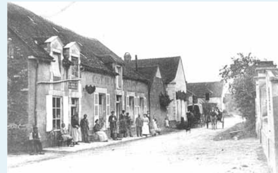
Les Bries - Grande Rue

Puis l'autoroute s'est construite (1964), le lotissement de La Baillie a vu le jour... Le hameau des Bries, qui comptait 200 ou 300 habitants, a vu ses fermes se transformer en maison d'habitation, des pavillons se construire en quantité.