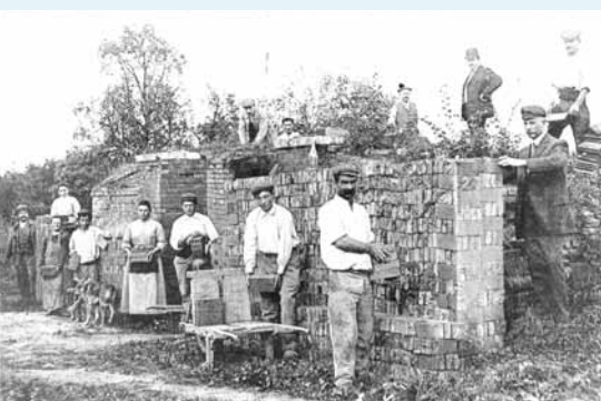
Les Bries - Tuilerie Pechenot-le Fourneau

La terre était extraite sur place. Elle servait à fabriquer des carreaux à four de boulangerie et des tuyaux de drainage. Elles disparurent faute de matière pre-